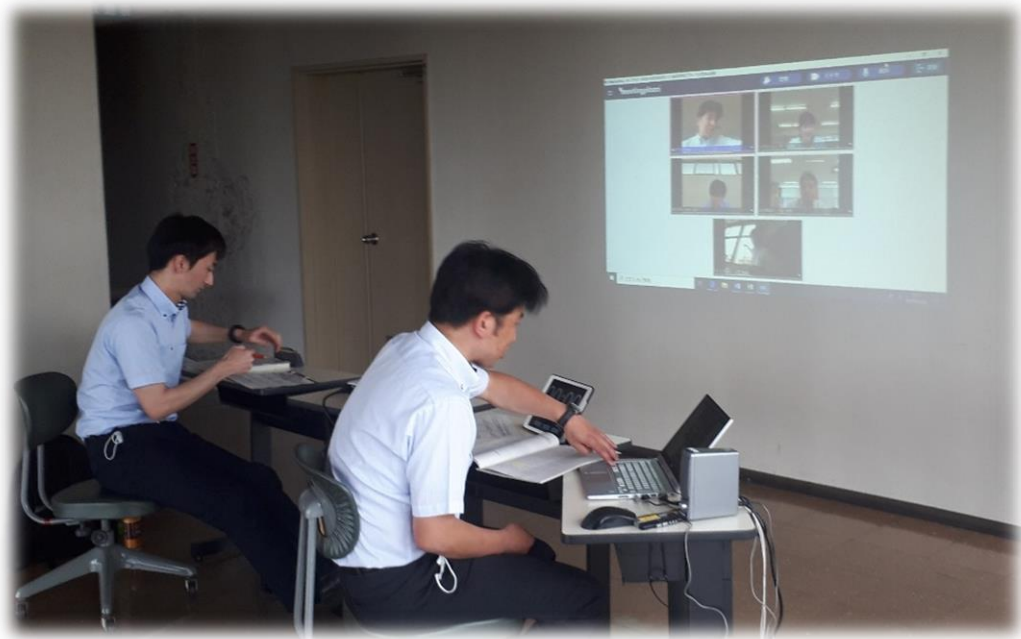
センター所員と講師（前年度当研修受講者） スクリーン上は本年度受講者